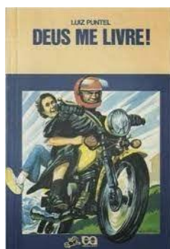
Deus me livre – Luiz Puntel Editora Ática