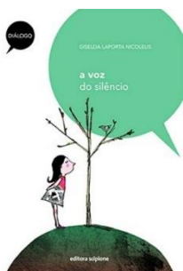
A voz do silêncio – Giselda Laporta Nicolelis Editora: Scipione