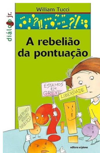
A Rebelião da Pontuação Autor: William Tucci Editora Scipione