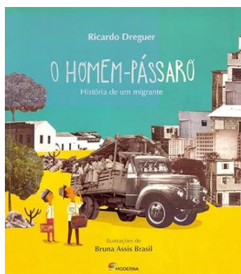
O Homem – Pássaro: Histórias de um migrante Autor: Ricardo Dreguer Ed. Moderna