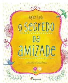
O segredo de uma amizade Autor: Wagner Costa Ed. Moderna