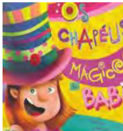
Os chapéus mágicos de Baby Autora: Edna Andes Sueli Lemos e Anna Anjos Editora Edebê

Sejam muito bem-vindos ao Ensino Fundamental I Um 2026 repleto de saúde e conquistas!