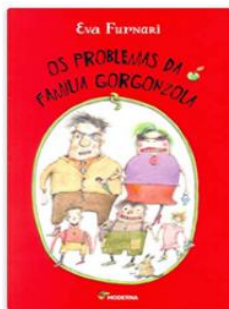
Os Problemas da Família Gorgonzola Autora: Eva Furnari Editora Moderna