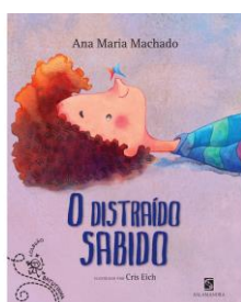
O distraído Sabido Autora: Ana Maria Machado Editora: Salamandra