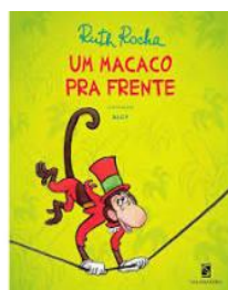
Um Macaco pra frente Autora: Ruth Rocha Editora: Salamandra